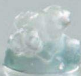
VARIOVISC® – hoch quervernetzte Hyaluronsäure