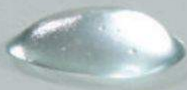
nicht quervernetzte Hyaluronsäure

VARIOVISC® positioniert sich nach Injektion zwischen dem Gelenk und wirkt als Gelenkschmiermittel und Polster.