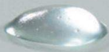
AH no entrelazado

VARIOVISC® se posiciona entre los huesos actuando como un lubricante y un cojín.